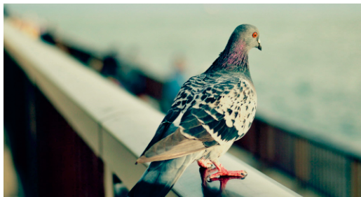
Местоположение на снимката: ул. Петко Непетов 28, Варна

Щракнах тази удивителна снимка вчера пред дома ми.