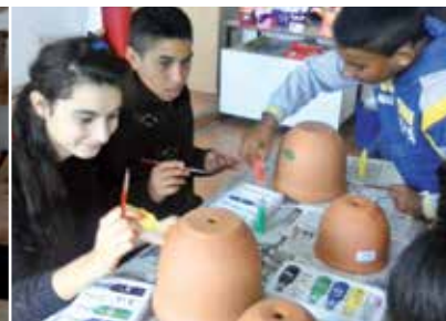
Selbst kreativ sein, Inspirationen umsetzen.

und realisiert: Studying, Training and Educational Paths for the Integration of young Roma (STEP IN: Lernen, Ausbilden, Erziehen – Wege zur Integration junger Roma). Konkret heißt das: Sprach- und Nachhilfeunterricht, Aktivitäten in Kunst und Handwerk, Sport, Kultur oder IT sowie ein Angebot an Exkursionen. Die Aktivitäten werden in Zusammenarbeit mit Schulen, lokalen und ehrenamtlichen Organisationen, kirchlichen und öffentlichen Institutionen, sozialen Dienstleistungsanbietern und Wirtschaftsunternehmen organisiert und durchgeführt. Wichtig für die Roma ist auch eine materielle Unterstützung: Die warme Mahlzeit, Stifte, Hefte, Sport- oder Spielausstattungen