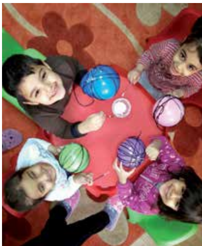
Vier, die viel Spaß beim Umwickeln von Luftballons haben.

Roma-Kinder aus der Gemeinschaft der Millet in den Räumlichkeiten des Vereins Sauchastie. Die zum Teil schwer traumatisierten Kinder können ihre Erlebnisse dort aufarbeiten und ihre Kindergruppe mehrmals wöchentlich besuchen. Sie erhalten Vorschulunterricht durch Pädagoginnen, auch Logopädie, lernen die bulgarische Sprache, mit Schere oder Kleber umzugehen oder sich an Regeln zu halten und natürlich feiern sie auch gemeinsam. Dabei fungiert eine Roma aus ihrer Gemeinschaft als kulturelle und sprachliche Vermittlerin. Einmal im Monat findet ein Elterntreffen statt, das dem Austausch und der Information dient. Seit Herbst haben die Roma-Kinder viele bulgarische Lieder gelernt, singen sie auch zu Hause und verwenden immer wieder bulgarische Begriffe beim Sprechen. Ihre Eltern bemerken dies anerkennend wie sie auch das gesamte Vorschulprojekt gutheißen.