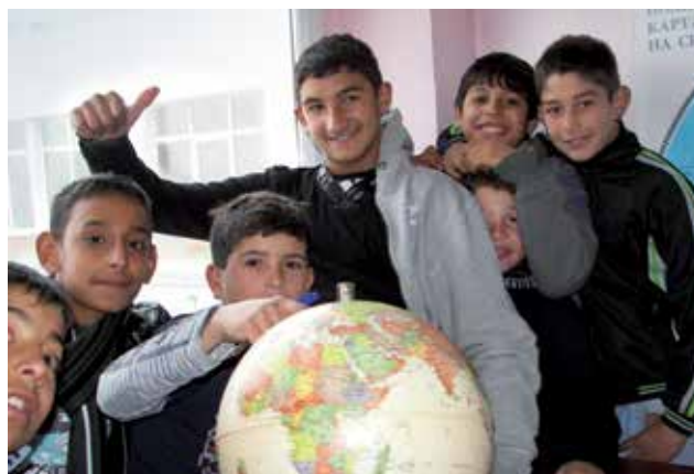
Die STEP-IN-Gruppe der Schule Dobri Vojnikov im Dorf Kamenar bei Varna ortet die Freunde in Deutschland.