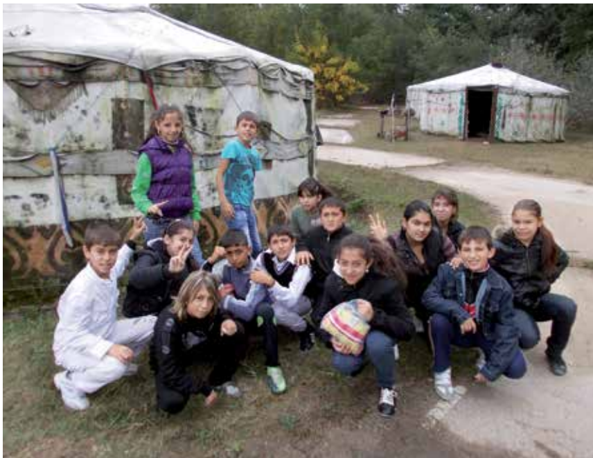
Dank des Bildungsprojekts STEP IN können die Schüler der Otez Paisij Schule in die Geschichte ihrer Vorfahren eintauchen – und haben großen Spaß daran. Hier besuchen sie den Nachbau eines proto-bulgarischen Dorfes und Kriegslagers aus dem sechsten bis achten Jahrhundert, gelegen im Asparuchovo Park von Varna.