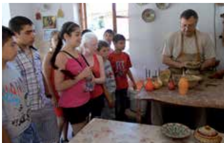
Möglich durch das schulergänzende Projekt STEP IN: Besuch einer Töpferei.