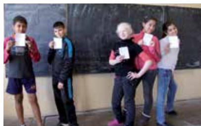
Wer was erarbeitet hat, möchte es auch präsentieren: Schüler einer Nachhilfegruppe des schulergänzenden Projekts STEP IN.

STEP IN wurde 2004 unter der Federführung von Caritas Ambrosiana (Mailand) und sieben Partner-Organisationen, darunter das BDS, entwickelt. Es richtet sich an 13- bis 18-Jährige